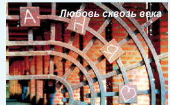
Любовь сквозь века