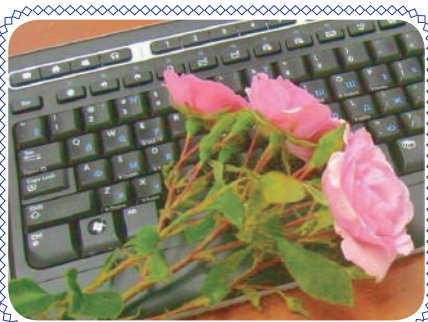
Спасибо! (стр. 7)