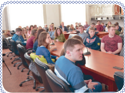
Обратная связь (стр. 2)