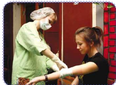
День донора в ИГЭУ (стр. 9)