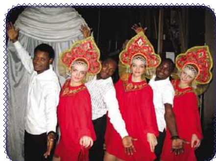
Международный день студента (стр. 12)