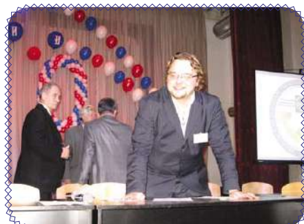
День открытых дверей (стр. 7)