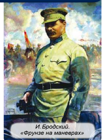
И. Бродский. «Фрунзе на маневрах»