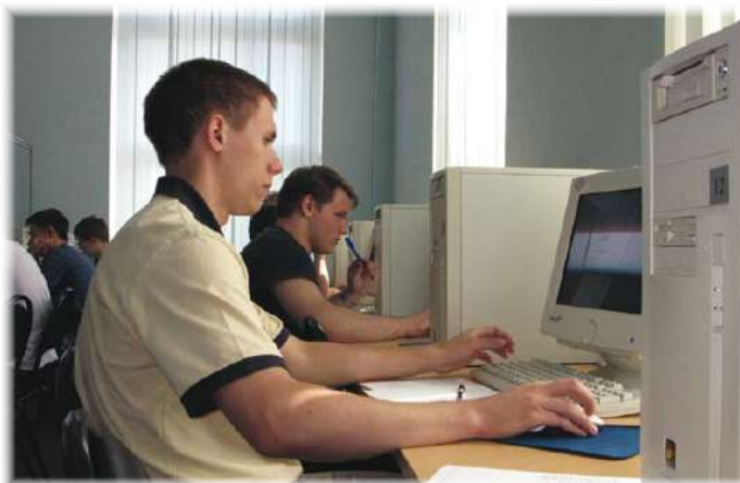
Олимпиады и конференции для школьников и студентов (стр. 4–6)