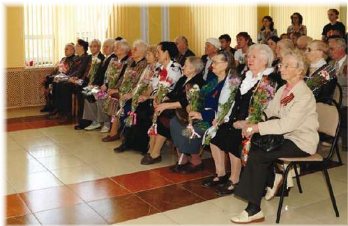
65-летию Великой отечественной войны посвящается... (стр. 8–11)