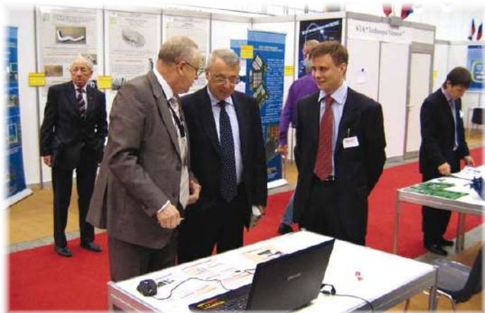
Научная жизнь ИГЭУ: международные победы и не только! (стр. 2–3)

Газета Ивановского государственного энергетического университета