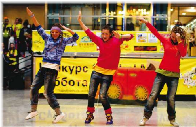
Яркие и активные, танцующие и поющие: наши звезды! (стр. 16–17)