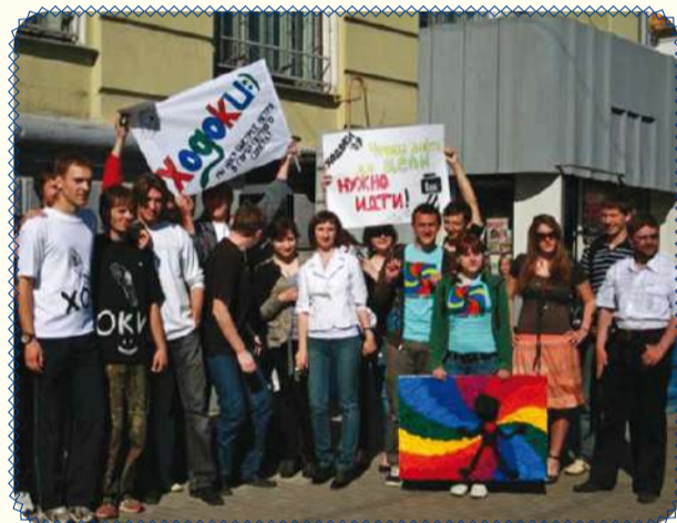
Энергеты показали себя в «Ходоках»! (стр. 5)