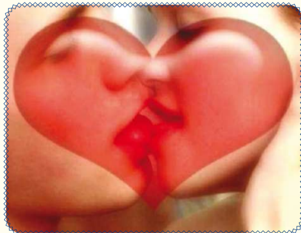
О любви небесной и земной (стр. 7)

И, наконец, газета ИГЭУ «Всегда в движении»... Если Вы сейчас это читаете, значит, Вы с ней уже знакомы! Каждый месяц издание выходит в печатном и электронном виде. Файлы и архивы со свежими номерами всегда можно скачать непосредственно на сайте ИГЭУ и на форуме в соответствующей теме. В темах форума Вы также можете оставить свои пожелания и предложения по каждому представленному ресурсу. Нам очень важно знать Ваше мнение! Координаты обратной связи отныне смотрите на 1-й странице каждого номера. Расскажите всем о своих достижениях, продемонстрируйте способности писателя, поэта или журналиста. Ждём Вас в редакции газеты в аудитории Б-238!