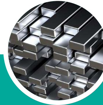
Продукты неорганической химии