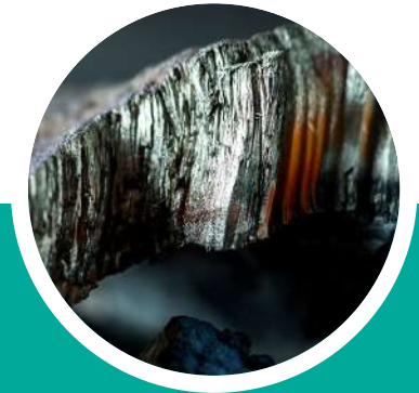
Соединения редкоземельных металлов