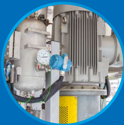
Технологические машины и оборудование