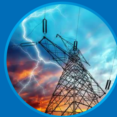
Электроэнергетика и электротехника