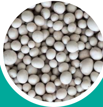
Азотные и сложные удобрения

Более 30 видов продукции, которая пользуется спросом в сельском хозяйстве и многих отраслях промышленности