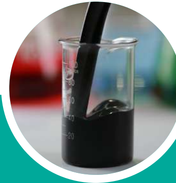
Продукты органической химии