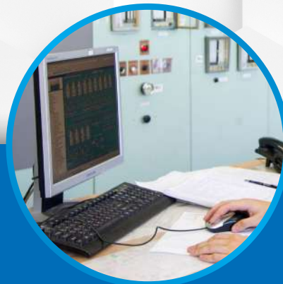
Автоматизация технологических процессов и производств