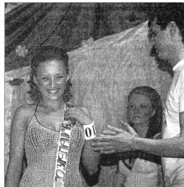
■ «Мисс Улыбка».