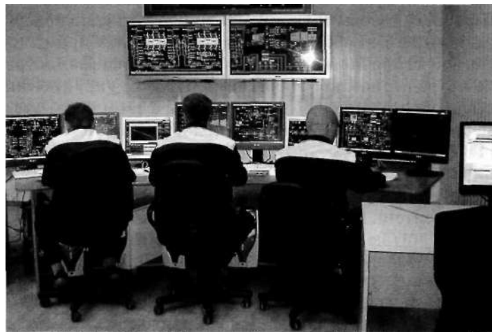
Рис. 2. Подготовка на тренажере энергоблока с интерфейсом ПТК «Квинт»

4. Модернизация маслобаков паровых турбин эрлифтными воздухоотделителями (ТЭС Башкирэнерго, Литовская ГРЭС).