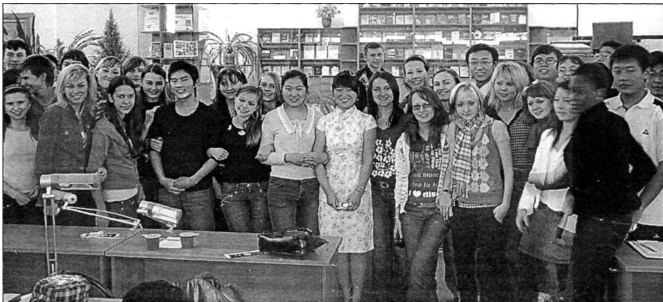
Студенты ИГЭУ и гости из Китая

Минувший год был богат на знаменательные даты и события. Одно из них — Год Китая в России. Мы поставили себе цель — познакомить студентов-первокурсников не только с культурой, традициями и развитием науки в Китае, но и студентами, их ровесниками, приехавшими на обучение в Россию из этой древней, самобытной страны. Поэтому самым незабываемым и интересным мероприятием, прошедшим в рамках программы «Путешествие в Поднебесную», стал вечер-встреча с китайскими студентами — участниками юношеского клуба «МПА». Гости рассказали о своей стране, городах, откуда приехали, пели песни на китайском и русском языках, танцевали, обучали первокурсников национальной игре в мяч и прививали навыки пользования палочками при еде, показали элементы кунг-фу. Закончился вечер чаепитием, но не в русских традициях с кренделями и баранками. Пришедшие на встречу студенты оказались участниками национальной церемонии чаепития: они дегустирова-