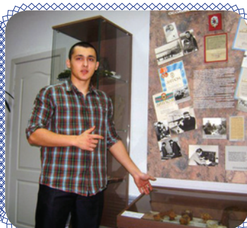
История в руках (стр. 7)