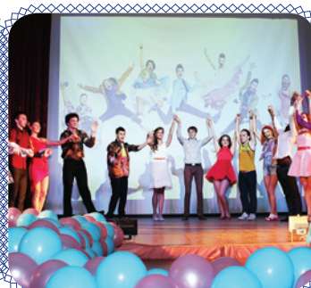
Мистер и Мисс ИГЭУ: кто круче?.. (стр. 12)