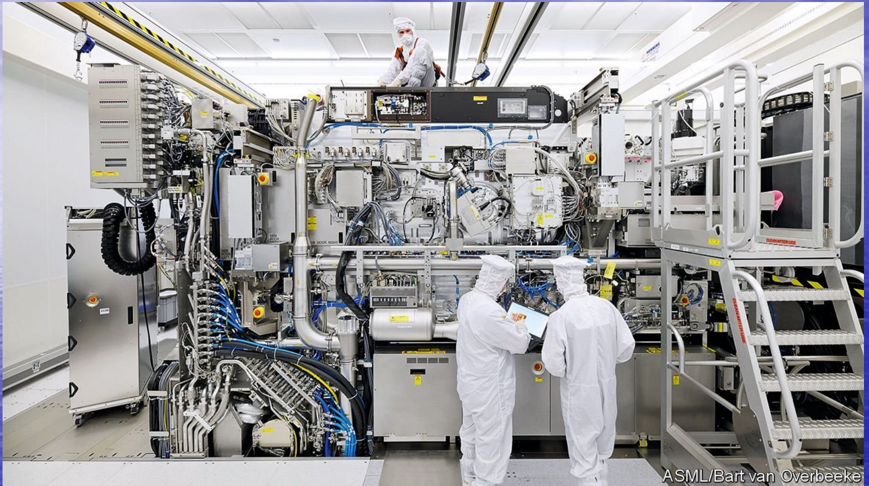
ASML/Bart van Overbeeke